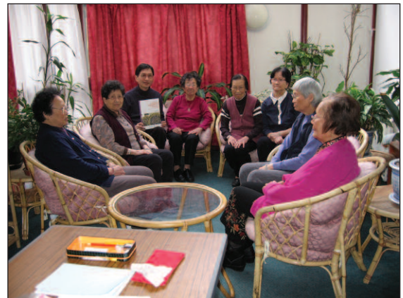
計劃聯絡主任們正在舉辦焦點小組討論